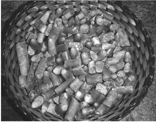
2 kg vættelys.

elighed og optimisme. Træerne tænker ikke "nej det her har vi ikke prøvet før, det har vi ikke bedt om, vi gider ikke" De prøver og håber det bedste. Med